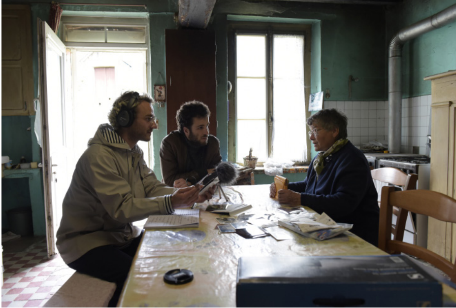
Entièrement peuplée #Ulysse. 2023 avec L'Hectare - Centre national de la marionnette. Lancé.