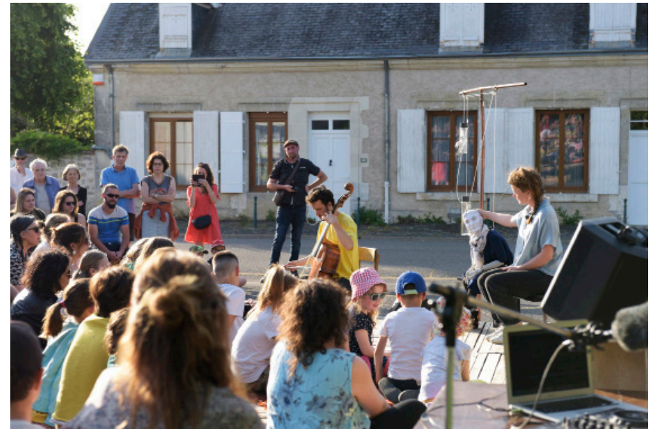
#Ulysse. Mai 2023 à Lancé (41) avec l'Hectar, Centre National de la Marionnette.

LE COLLECTIF LE PRINTEMPS DU MACHINISTE RASSEMBLE DES ARTISTES ISSUS DU THÉÂTRE, DE L'ÉCRITURE, DE LA MUSIQUE, DE LA PHOTOGRAPHIE. AVEC LA MARIONNETTE POUR PRINCIPAL OUTIL, NOUS PENSONS CHAQUE SPECTACLE COMME UN NOUVEL ESSAI. AU COURS D'IMMERSIONS, NOUS RECUEILLONS DES PARTS D'INTIMITÉS DES PERSONNES RENCONTRÉES, POUR LES RESTITUER AU GRAND JOUR. NOUS VOULONS TROUVER LA FAILLE, NOUS IMMISER DANS LA MACHINE, METTRE DES BOUTS DE CHAIR DANS DES BOUTS DE FER.