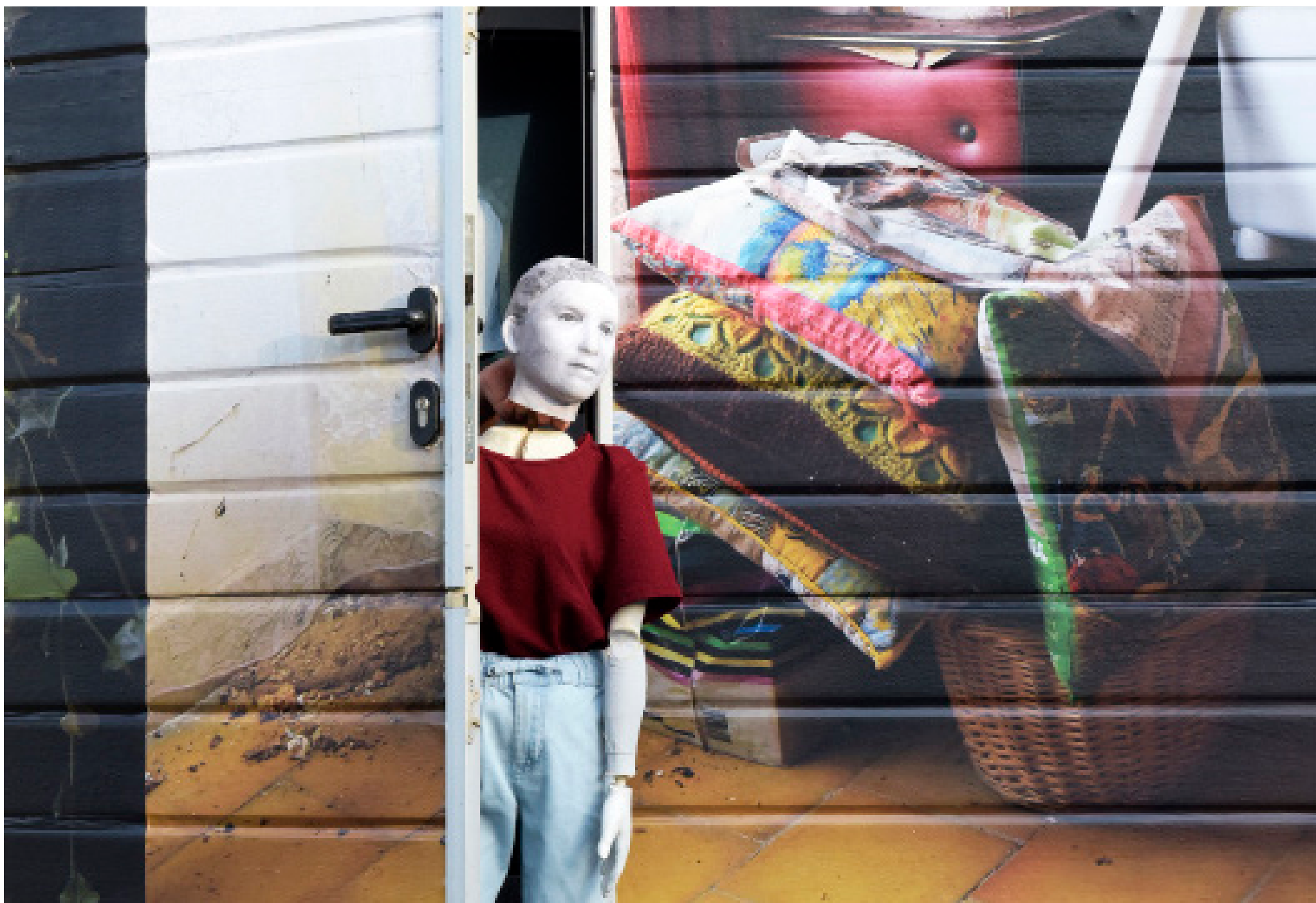
#Ulysse. Mai 2023 à Lancé (41) avec l'Hectar, Centre National de la Marionnette.