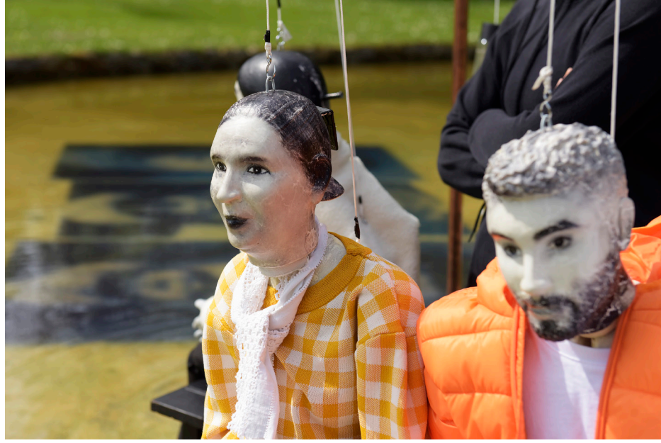
Entièrement peuplée Narcisse. 2021-2023 à Villarcieux avec le PIVO, scène conventionnée Art en territoire.